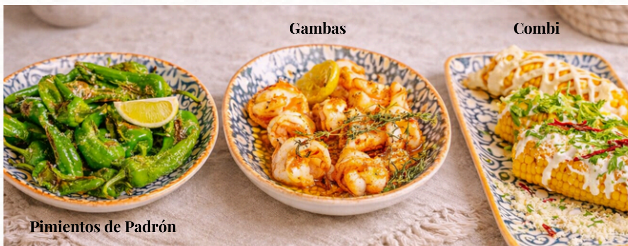
Pimientos de Padrón

Eine Auswahl aller drei Maiskolben-Kreationen – perfekt zum Teilen oder Probieren.