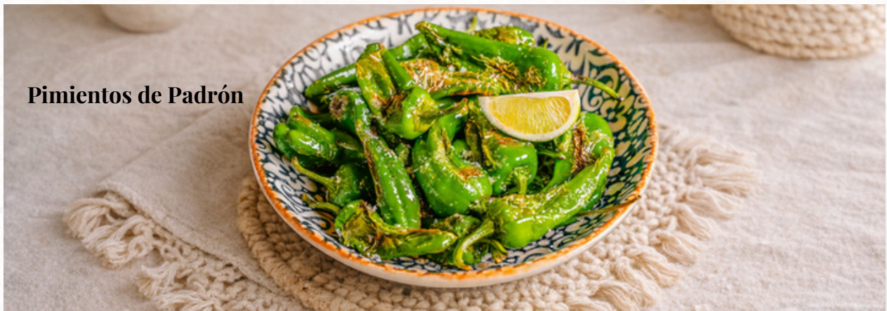
Pimientos de Padrón