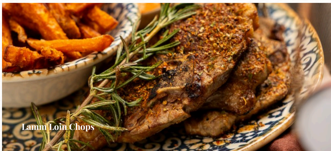
Lamm Loin Chops

Zart gegrillt - mit mildem Aroma vom Lavastein. Serviert mit Arroz Rojo (mexikanischer roter Reis mit Kräutern) und einer Sauce nach Wahl, garniert mit frischer Salatgarnitur. (Dip anstelle der Sauce +1.00)